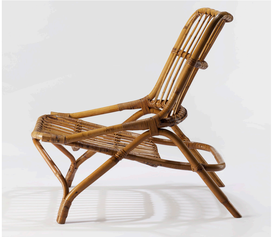
Fauteuil «Sabre» Rougier 1953