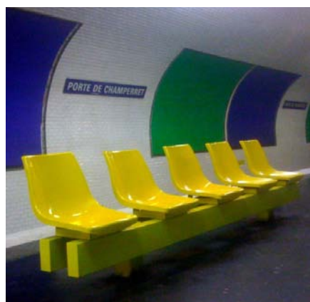
Siège «Motte» RATP 1973