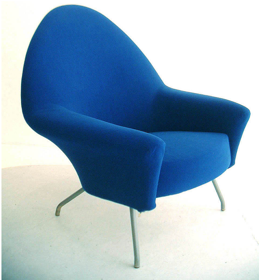
Fauteuil 770 1958

La collaboration de Motte avec Steiner débute dans le cadre de l'ARP, ou sa participation se signale notamment par le fauteuil « Saturne » ou « Radar » et la table lumineuse au salon des arts ménagers de 1955. Mais l'essentiel de leur travail en commun est centré sur les années 1957-1958 avant la période des grandes commandes publique tel l'Aéroport d'Orly qui vont l'accaparer dans la décennie suivante. Cette collaboration gravite autour d'une exceptionnelle lignée de sièges produits en grande série. Quatre méritent d'être retenus. Le fauteuil 740 présenté au Salon des arts ménagers de 1957 ou il obtient le prix René-Gabriel, a pour originalité d'être livrable en kit. L'assise et le dossier étant composés de pièces identiques. La chaise 771, exposée en 1958 au Salon des arts ménagers, repose sur le même principe, la forme en écu de l'assise et du dossier lui confère un aspect très dynamique. Le fauteuil et le canapé 770, conçus la même année, montrent des formes englobantes dont l'élégance et la légèreté sont une véritable prouesse technique. Également de 1958, le fauteuil bridge sur patin 763, adaptable aux cadres les plus divers, bénéficiera d'une large diffusion dans les collectivités.