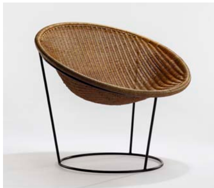
Fauteuil «Catherine» Rougier 1952