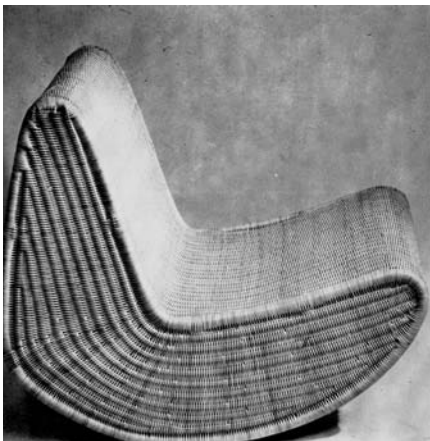
Rocking chair 1963

Motte dessinera au cours de sa carrière d'autres modèles en rotin qui seront, chacun à sa manière, un petit événement technique et formel. On retiendra le fauteuil « Catherine » de 1952, le fauteuil « Sabre » de 1953. L'année 1963 verra l'apothéose de ce matériau avec un étonnant rocking chair, le fauteuil « Girolle » en canne de rotin, une chauffeuse constituée de panneaux de rotin tréssé et plié ainsi qu'un étonnant système d'éléments en rotin combinatoire permettant de constituer des assises, des tables, des étagères à partir du même module.