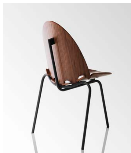
Chaise A6 1959/2011